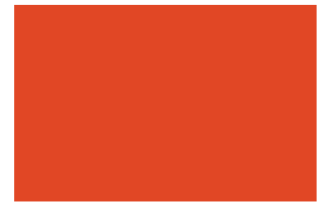
420 x 275 px (ouverture) 1800 Euros