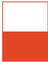
210 x 137,5 px 590 Euros