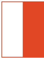
105 x 275 px 590 Euros