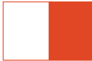
210 x 275 px (3-eme de couverture) 1100 Euros